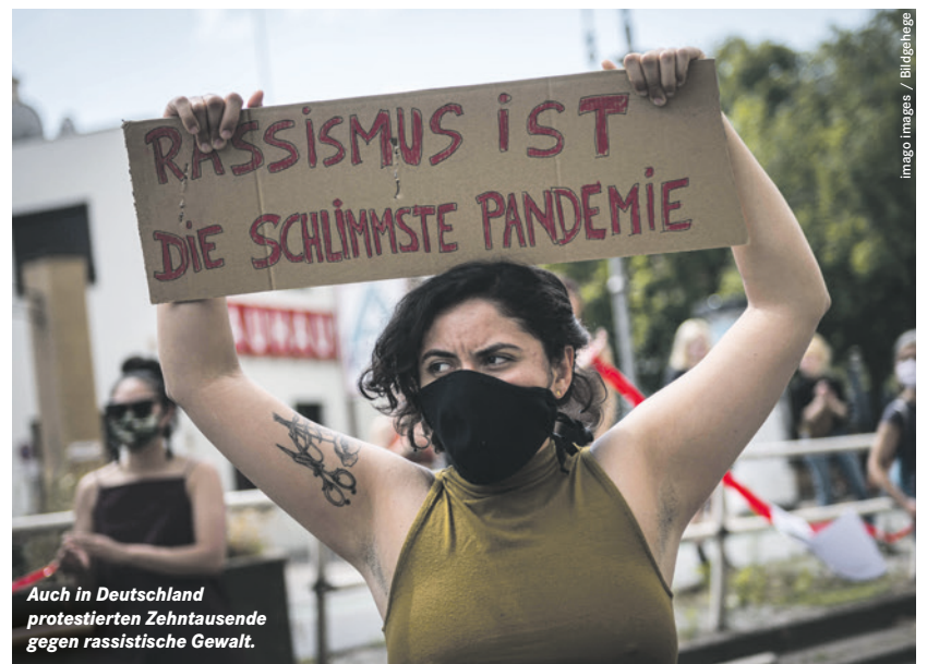
Auch in Deutschland protestierten Zehntausende gegen rassistische Gewalt.

Wer Rassismus bekämpfen will, muss bei der Sprache anfangen. DIE LINKE fordert seit 2010, den Begriff Rasse aus Rechtsdokumenten zu streichen. So etwa im Grundgesetz, wo es in Artikel 3 heißt, niemand dürfe wegen seiner »Rasse« benachteiligt werden.