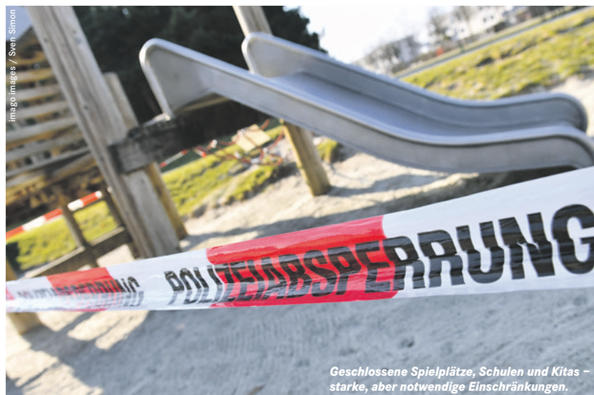
Geschlossene Spielplätze, Schulen und Kitas – starke, aber notwendige Einschränkungen.

DIE LINKE fordert deshalb: Es darf keine Entmachtung der Parlamente in Bund, Ländern oder Kommunen geben, keine (Selbst-)Ermächtigung der Exekutive. Politische Betätigung muss möglich bleiben. Kein Einsatz der Bundeswehr im Innern!