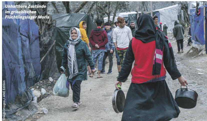
Unhaltbare Zustände im griechischen Flüchtlingslager Moria

ausgehend haben daher mehrere Bundesländer beschlossen, selbst Geflüchtete aus Griechenland aufzunehmen. Zu den Bundesländern, die Geflüchtete aufnehmen wollen, gehören Hamburg, Sachsen, Berlin, Hessen und natürlich Thüringen, das sogar 500 aufnehmen möchte und damit den Rekord hält. Auch auf kommunaler Ebene gibt es aus dem Netzwerk der solidarischen Städte viele Erklärungen zur Aufnahmebereitschaft. Viele Kommunen erklärten, dass Unterkünfte einschließlich der Möglichkeit zur Quarantäne vorhanden sind.